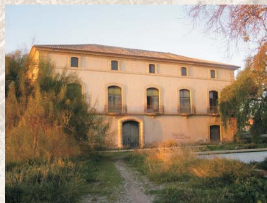
Camino de acceso a la finca por el noreste y fachada principal orientada al sureste

La casa es un magnífico ejemplo de residencia palaciega. Tiene planta rectangular y tres pisos. En la planta baja hay un vestíbulo central cruza toda la casa, una bodega situada al este y a poniente hay varias habitaciones y una singular escalera que comunica con la planta primera.