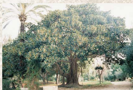
Pérgola y ficus del jardín