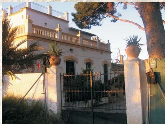
Casa lo de Bellón de Fuera Casa lo de Bellón de Enmedio

Era la casa que ocupaban los caseros de la finca a la que perteneció y estaba destinada a usos agrícolas. Su estructura y distribución se identifica dentro de la arquitectura popular.