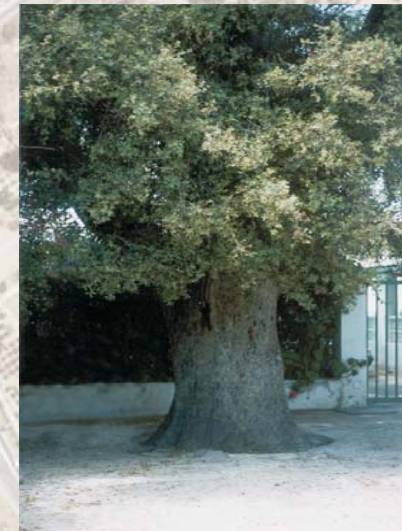
Encina centenaria en el camino de la Princesa

La finca de la Princesa está situada en la partida de Fabraquer limitando con el término municipal de Mutxamel. No se sabe con exactitud la fecha de su construcción, pero es posible que su origen esté en el siglo XVI. El aspecto actual de la casa se debe a las obras realizadas durante el siglo XVIII.