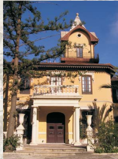
Arco de entrada y edificio principal

Un arco de entrada con cancela de hierro da paso a un camino empedrado que conduce al patio en el que se encuentra el edificio principal y una pequeña capilla. La vivienda tiene tres plantas. La inferior está en semisótano. La planta baja tiene distintas dependencias y un patio interior que facilita la iluminación y ventilación. La superficie construida en el piso superior es menor que la planta baja lo que permite la formación de terrazas de grandes superficies. Las cubiertas son inclinadas con gran pendiente y rematadas por crestería cerámica. Sobre ellas destaca la esbelta torre cuadrangular con un balcón corrido perimetralmente.