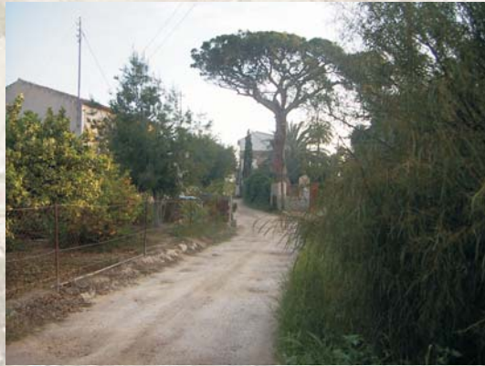
Camino de acceso a la Casa de lo de Bellón de Dentro

el siglo XX. La pintura original en ocres en la gama rojiza y amarillenta ha sido sustituida por el blanco con molduras y recercados en ocre. La casa de Bellón del Medio data del siglo XIX.